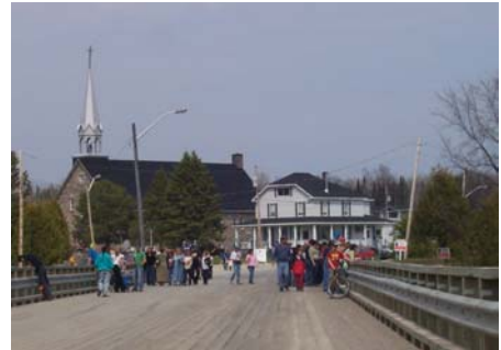
La municipalité de Rémigny

Le nom de la localité honore le capitaine de Rémigny qui servait dans le régiment de La Sarre de l'armée de Montcalm lors de la Conquête de la Nouvelle-France en 1760.