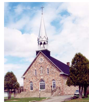
L'église de Rémigny

Il est également possible de voir un ancien moulin à aubes construit en 1938. L'église, le vieux moulin et la zone du Boom camp, un ancien camp de drave, sont des sites d'intérêt historique. De plus, un sanctuaire de pêche, considéré comme un site d'intérêt naturel, est présent sur le territoire.